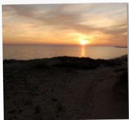
DUNE DI CAMPOMARINO

*Cena presso Ristorante Lu Frizzulu , a Maruggio, a circa 1,5 Km da Villa Boschetto. Menù di San Valentino