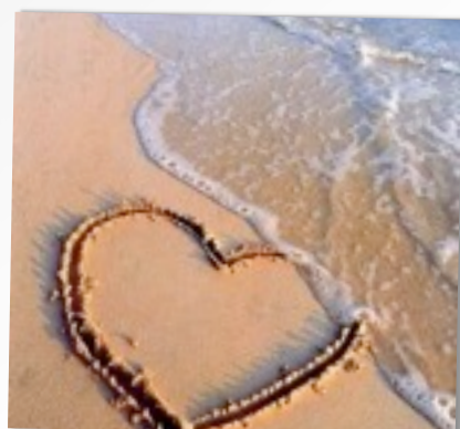
14 FEBBRAIO 2012